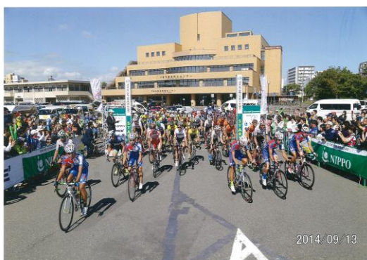
第1ステージ スタート 千歳市役所駐車場