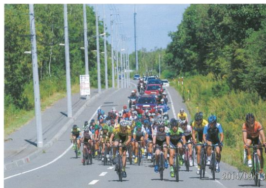
第1ステージ 競技状況 千歳市郊外